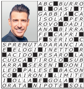
pag. 3 PAROLE INCROCIATE