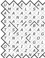
pag. 34 PERCORSI INCROCIATI