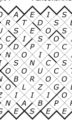
pag. 5 SUDOKU... LETTERALE