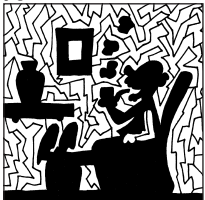
pag. 10 CRITTOCRUCIVERBA