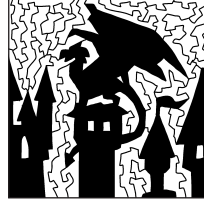
pag. 10 CRITTOCRUCIVERBA

EVEREST, LA, ARONA, CASTI, NOCI, CANCAN, ISI, FORTUNA, COMPASSARE, E, GENTILE, G, CONSTATO, SI, PANTERA, LEO, FINIRE, PELI, N, NATI, GIAVA, NO, I, ATTURA