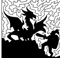
pag. 8 LA VIGNETTA CELATA