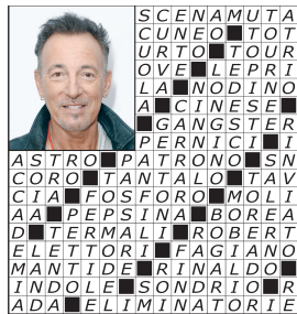
pag. 1 PAROLE INCROCIATE