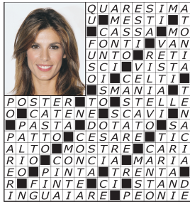
pag. 3 PAROLE INCROCIATE