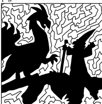
pag. 10 CRITTOCRUCIVERBA